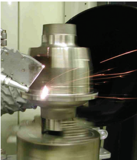
Abb. 3: Industrielle Umsetzung des Laserstrahlreinigens von Fügstellen für nachfolgendes Laserschweißen Ersatz von Waschanlagen

Es gilt, Markteintrittsbarrieren frühzeitig zu identifizieren, gezielt zu überwinden und die mit der Einführung neuer Technologien einhergehenden Risiken zu minimieren.